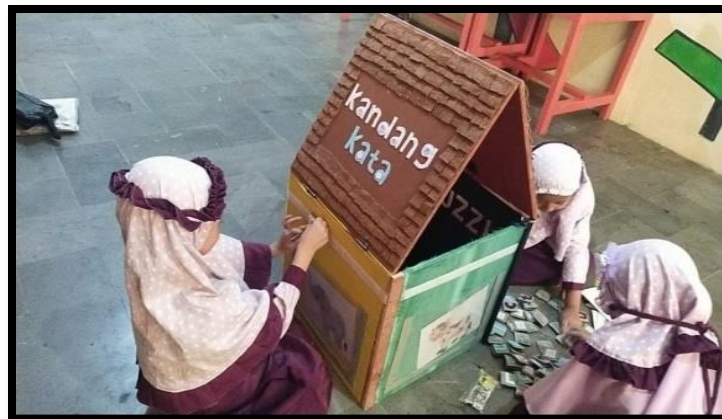
Gambar 4.1 Media Kandang Kata

Berdasarkan hasil penelitian dan pembahasan mengenai media pembelajaran Kandang Kata dalam pembelajaran bahasa anak di PAUD Modern Al-Rifa'ie dapat disimpulkan bahwa media pembelajaran kandang kata ini dikembangkan untuk meningkatkan aspek perkembangan bahasa anak di PAUD Modern Al-Rifa'ie dengan menampilkan 6 konsep permainan yang terkandung dalam media pembelajaran tersebut. Media pembelajaran ini banyak mengandung unsur bercerita karena terdapat beberapa gambar binatang dan terdapat konsep permainan bercerita tentang metamorphosis kupu-kupu dan ayam. Aspek bahasa yang terkandung dalam media pembelajaran tersebut adalah untuk meningkatkan aspek membaca dan menyimak anak dengan mengeja dan menyusun abjad-abjad menjadi nama binatang tersebut.media pembelajaran ini memiliki 4 tingkatan dalam konsep permainan menyusun nama binatang seperti nama binatang sapi berada dalam tingkatang pertama, ayam dalam tingkatan ke 2, bebek dalam tingkatan ke 3 dan kucing berada dalam tingkatan ke 4. Adapun bentuk media kandang kata yang telah dibuat oleh peneliti, terlihat pada gambar 4.1 , sebagai berikut :