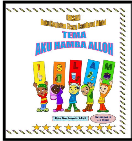
Gambar 4.2 Cover Bahan Ajar Buku

Tahap design merupakan tahap pembuatan rancangan isi BKSRA dan pembuatan rancangan tampilan BKSRA. Rancangan BKSRA mempunyai dua bagian utama yaitu bagian pra isi dan bagian isi materi. Bagian pra isi yaitu halaman judul, kata pengantar dan nama penulis. pada bagian isi materi yaitu materi, tema, sub tema, tujuan pembelajaran, lingkup perkembangan, muatan materi, kompetensi dasar, nilai, karakter, paraf guru dan nilai.