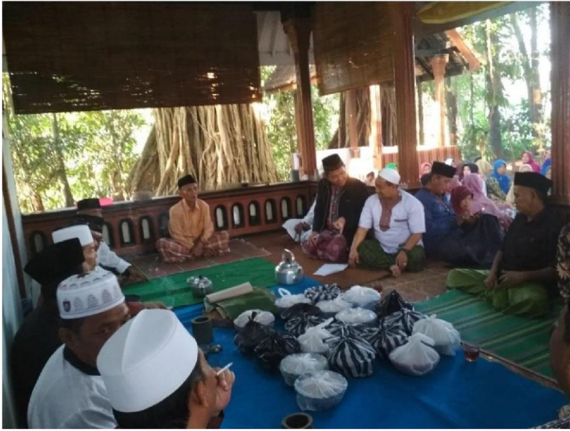
Gambar 2: tokoh-tokoh agama pada acara nyadran di Dusun Sukoarum

berpartisipasi melestarikan budaya nyadran ; (4) ikut serta dan sekaligus sebagai Pembina kegiatan tradisi budaya nyadran di Dusun Sukoarum.