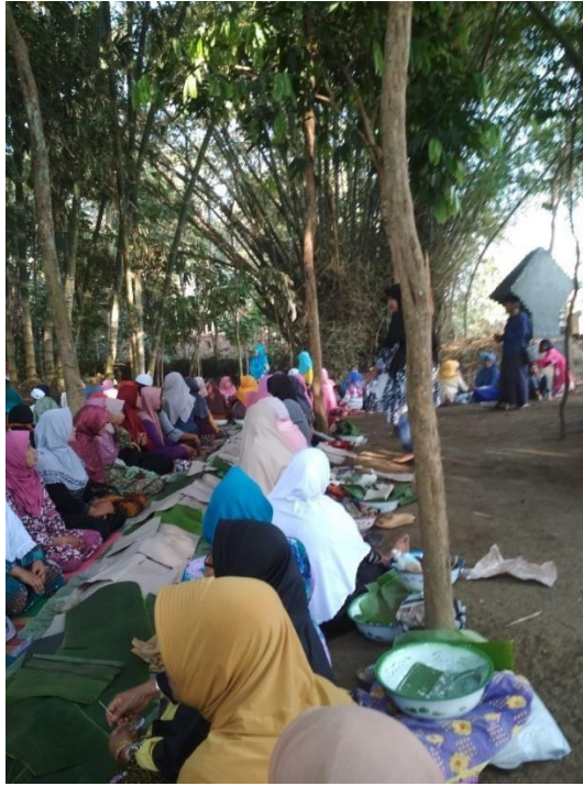
Gambar 3: Acara nyadran di Dusun Sukoarum