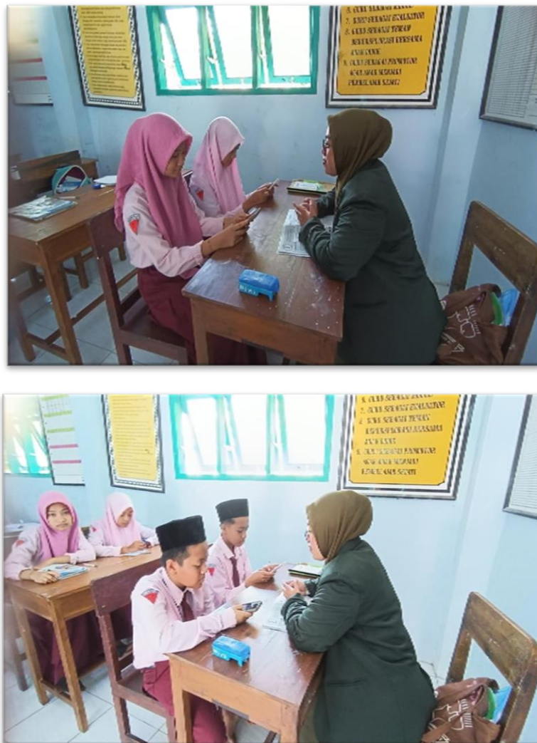
Gambar 4.3 Aktivitas Tes Awal Siswa Kelas VII MTs Daarus Salam

membaca dengan cara menghitung berapa kata yang telah dibaca dengan waktu 1 menit dan untuk pemahaman membaca dilakukan tes menjawab beberapa pertanyaan.