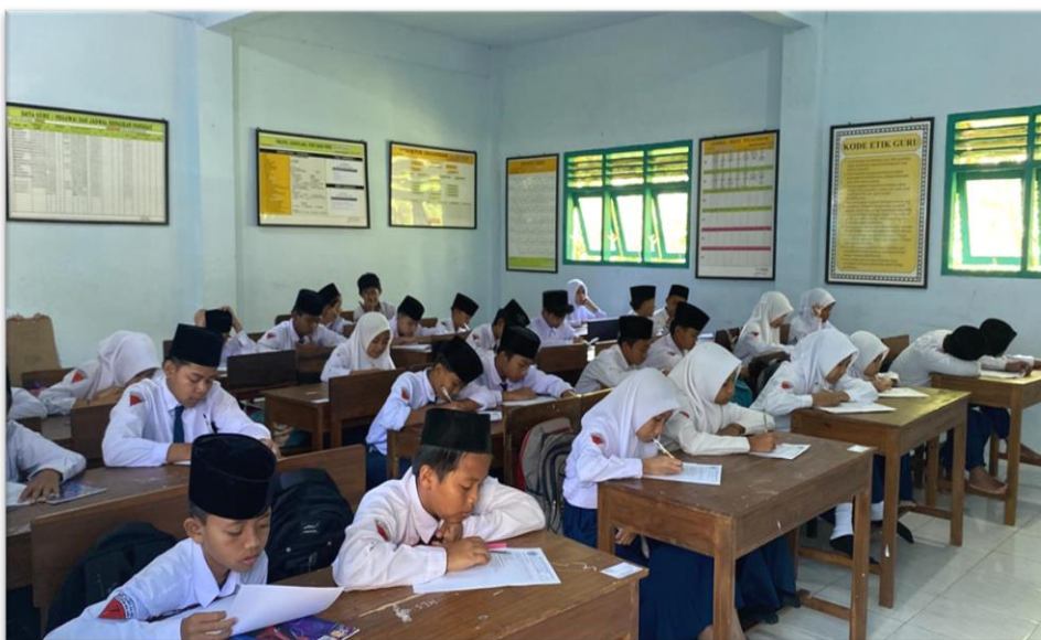
Gambar 4.15. Aktivitas Siswa Mengisi Soal Tes Pemahaman Membaca Tahap II

Data kedua dalam penelitian ini berisi jawaban soal tes pemahaman membaca. Mereka kembali membaca buku yang telah dipilih, setelah itu peneliti memberikan butir soal untuk dijawab. Setelah melakukan tes tahap II, maka dapat diketahui apakah ada peningkatan pemahaman membaca setelah melakukan tes di tahap I. setelah melakukan tes, peneliti dan siswa menghitung bersama hasil tes tahap II. Tes tahap II dilakukan siswa dengan serius, berkonsentrasi dan juga tidak banyak berbicara dengan teman sebangkunya. Namun masih ada siswa yang masih kurang berkonsentrasi mengerjakannya.