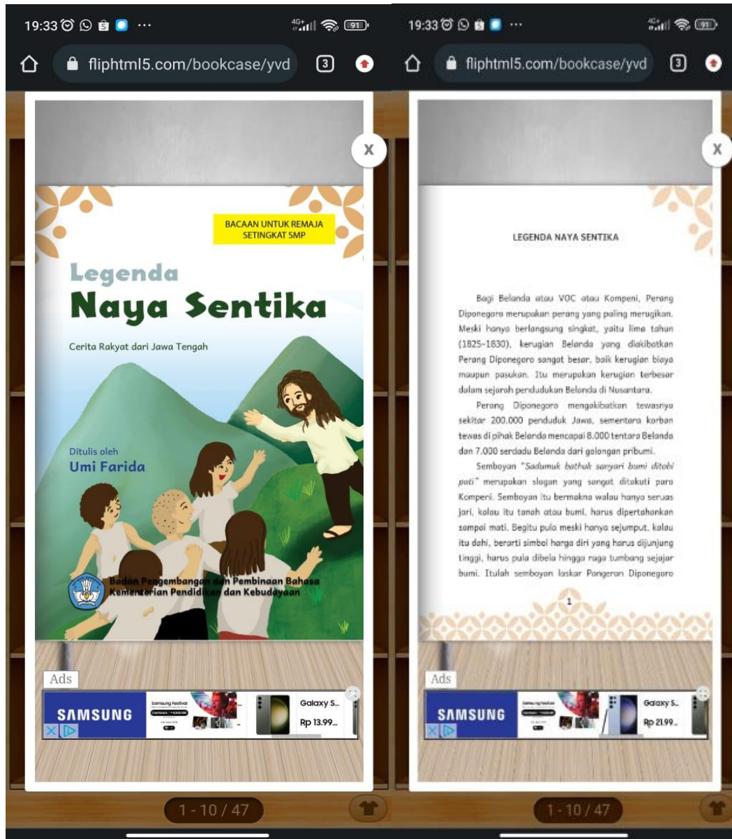
Gambar 4.6 Buku bacaan Legenda Naya Sentika . Perpustakaan Daarus Salam

Gambar 4.6 adalah salah satu koleksi buku di perpustakaan online MTs Daarus Salam. Setelah membaca buku Legenda Naya Sentika , siswa kelas VII mengikuti tes tahap kedua agar mengetahui kecepatan membaca dan pemahaman setelah memperoleh keterampilan membaca efektif dengan menggunakan teknik skipping .