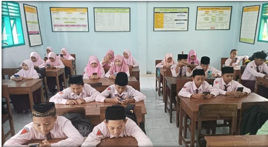
Gambar 4.1. Kegiatan Siswa Membaca Buku di Perpustakaan Online

Setelah siswa memilih sebuah bacaan, para siswa bertahap maju untuk melakukan tes. Selanjutnya yaitu menghitung hasil dari tes. Hasil dari tes ini, dapat dilihat kondisi awal siswa sebelum mempelajari keterampilan membaca cepat untuk memahami isi bacaan dan setelah melakukan kemampuan membaca cepat sebagai upaya pemahaman bacaan.