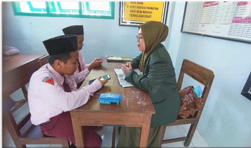
Gambar 4.4 Aktivitas Siswa Melakukan Tes Kecepatan Membaca

Data ini berisikan penilaian siswa mengenai penilaian kecepatan membaca.