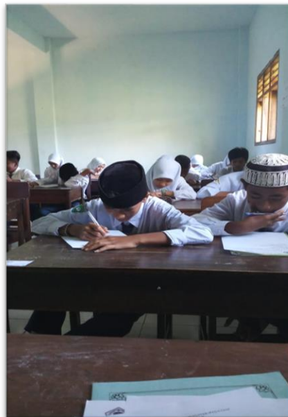
Gambar 4.5 Aktivitas Siswa Menjawab Pertanyaan Tahap I

Data kedua ini berisi penilaian siswa dalam menjawab beberapa pertanyaan mengenai pemahaman dalam membaca. dan hasil dari menjawab pertanyaan tersebut nanti akan diketahui berapa persen siswa memahami bacaan buku yang telah mereka baca. Sebelum melakukan tes pemahaman membaca, para siswa diberikan penjelasan, kemudian para siswa memilih buku bacaan yang ada diperpus Daarus Salam. Setelah memilih bacaan barulah siswa membaca dan menjawab soal yang diberikan oleh peneliti sebanyak 25 butir soal pertanyaan, selanjutnya peneliti menganalisis skor nilai untuk mengetahui jumlah nilai yang diperoleh.